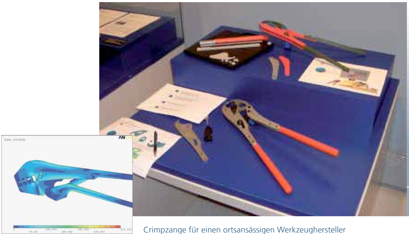
Crimpzange für einen ortsansässigen Werkzeughersteller

Begleitung einer Werkzeugentwicklung und Unterstützung durch FEM-Simulation und Prototypenerstellung.