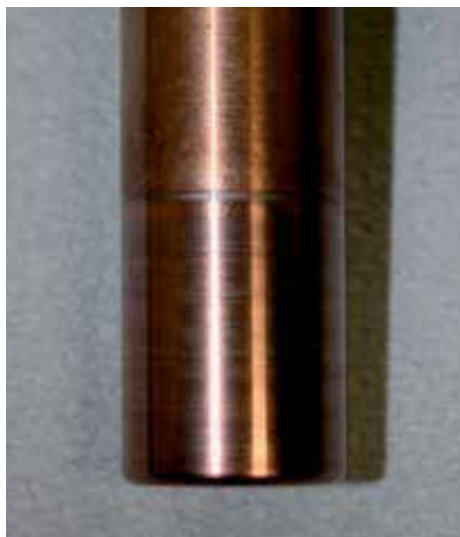
Oberfläche der Tiefziehstempel nach 58000 (links unbeschichtet) und 196000 (rechts TiCN-beschichtet) Tiefzierteilen