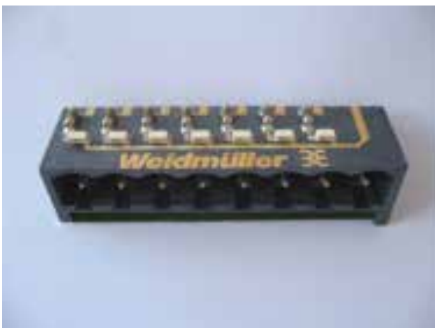
Laserstrukturiertes und metallisiertes Kunststoffbauteil, welches mittels SMD bestückt wurde